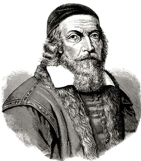
Jan Amos Komenský (1592–1670), filozof a spisovatel.

A právě fakt, Němec nebo Čech – píchni jako řízni , nic nemění na tom, že se nová a tvrdší vlna rekatolizace Evropy v dalších letech střetává s touhou po svobodě vyznání. Nebo to protivníci jako důvod pro zabíjení uvádějí. Jako by chtěl rigidní