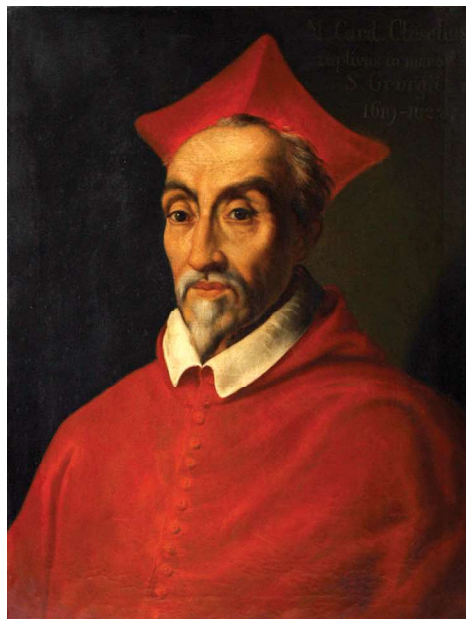
Melchior Khlesl, Matyášův rádce a mentor.

kvalifikaci. A dlužno dodat, je v ní úspěšný a dosáhnout cíle, být úspěšným politikem a státníkem , se mu daří. Zato Matyášovi se nedaří skoro nic, začíná ho zrazovat i zdraví a klid mu nepřidá ani tlak na nutnost rozhodnout o následníkovi. On sám je bezdětný, stejně jako byl bratr, a tak těch, kteří se považují za ty pravé , je jako much. Tlačí církev, tlačí i španělská linie rodu. Není divu, konflikt mezi protestanty a katolíky nabírá obudných rozměrů a říše potřebuje kontinuitu vlády a moci.