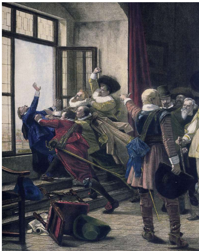
23. května 1618, defenestrace, začínají krvavé dějiny.

Defenestrace posílí vzbouřenecké tendence protestantských šlechtických stavů, a když se připojí i Morava, Slezsko i Rakousy, je oheň na střeše. Rozumí se: na střeše habsburského domu. Ferdinand II. prosazující tvrdou rekatolizaci země nekompromisně zavádí ústavní absolutismus. Povstalci, zatím silní a odhodlaní, jej