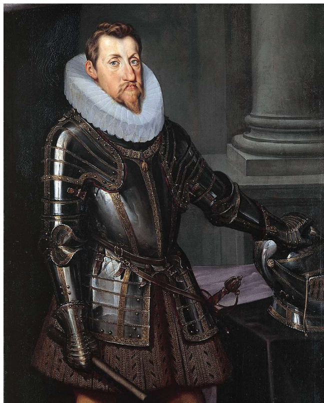
Ferdinand Štýrský, nová hvězda politického nebe Habsburků.

Není proto divu, že Matyáš po nástupu na trůn likviduje vše, co bratra Rudolfa připomíná. Vrací sídlo říše do Vídně a bratrův odkaz se snaží všemožně překrýt vlastními hospodářskými i politickými kroky. Ale jako kdyby ziskem koruny ztratil vizi i motiv. Praktický výkon vlády v říši nechává stále víc na svém kancléři a dlouholetém rádci, generálním vikáři biskupství v Pasově a od roku 1613 také vídeňském biskupovi a kardinálovi, Melchioru Khleslovi. Těch třicet let, po která je Matyášovi po boku, bere Khlesl, syn pekaře, jako jakousi re-