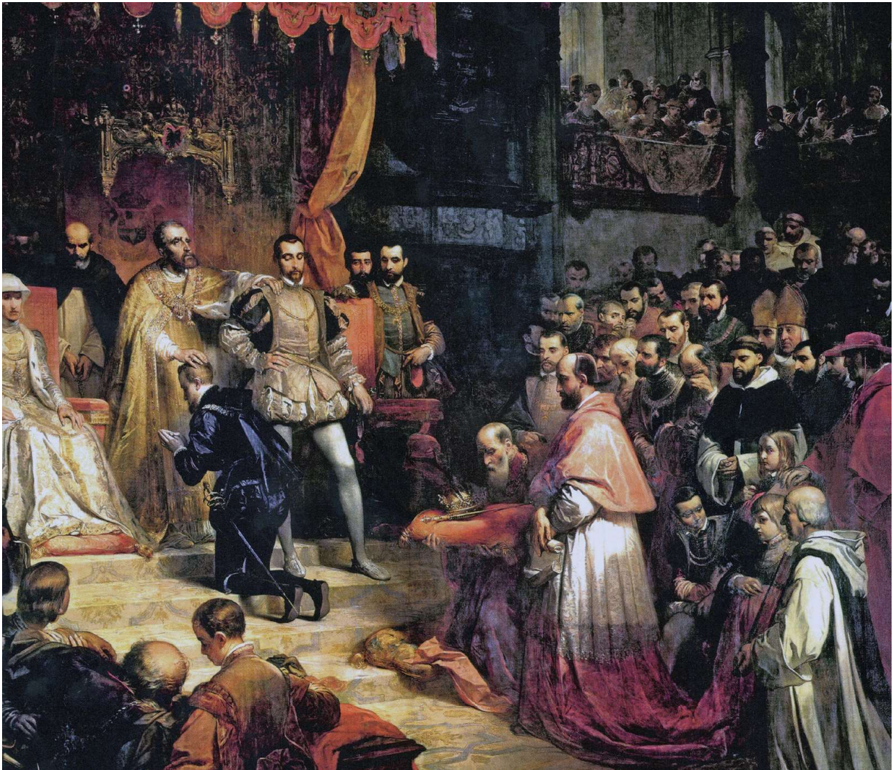
Karel V. byl mužem, který věděl, kdy odejít. Zde při předání vlády v Nizozemí synu Filipovi II. (obraz Louis Gallait 1841).

Karel V. se stane prvním císařem světa! Doslova! Vezměte do rukou mapu či globus. Pod jeho vládu spadá dnešní Španělsko, Nizozemí, Belgie, Lucembursko, Lichtenštejnsko, Rakousko, Německo, Česko, Maďarsko, Slovinsko, Chorvatsko, část Francie, většina Srbska, část Polska, Bulharska, Makedonie, Ukrajiny. Máte to?! Tak dál: jih USA, Mexiko, Kostarika, Nikaragua, Panama, Honduras, Salvador, Kuba, Haiti, Portoriko, Guatemala, Belize, Bahamy, Dominikánská republika, Jamajka, Britské Panenské ostrovy, Antigua a Barbuda, Montserrat, Dominika, Svatá Lucie, Svatý Vincent a Grenadiny, Grenada, Trinidad a Tobago, Guayana, Surinam, části Kolumbie, Venezuely, Ekvádoru, Peru, Chile, Uruguaye, Argentiny a Brazílie, celé Filipíny, Šalamounovy ostrovy, Borneo, Nová Guinea. Stačí?!