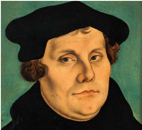
Martin Luther (1483–1546), německý teolog, kazatel a reformátor.

jako zkoušet spojit olej s vodou. Sama církev již dvě desítky let řešila vážné vnitřní rozpory a její autorita po husitských bouřích v Čechách a trojpapežství je víc než otřesena. Zdá se, že právě církev a říše potřebují zásadní reformu. Krokem k řešení byla císařova tzv. volební kapitulace před korunovací, již nabídl část pravomocí kurfiřtům a říšským sněmům.