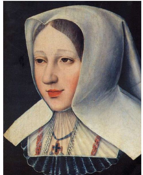
Markéta Rakouská zastupující zájmy Habsburků v Nizozemí je začátkem 16. stol. ženou s největším politickým a diplomatickým vlivem.

dek se dostaví, jak se ukáže později. Přesto císař Karel V. prožívá nejšťastnější roky. Jeho císařský dvůr v Madridu je zaplněn velkými umělci, vědci a osobnostmi doby. Navíc z původně jen strategické svatby s Isabelou Portugalskou se vyklube velmi šťastné manželství. Proto její smrt po třinácti letech císaře opravdu zarmoutí a ten, nejen oblečením, drží smutek po celý zbytek života. Jeho císařský klid ruší jen František I. Francouzský, který není schopen strávit volební porážku. Mimo celé řady Karlových protivníků má podporu i Klementa VII., což řadí papeže do řad nepřátel Svaté říše římské. Proto dalších 17 let přinese tři války a odnese spoustu peněz. Rakousko i Francie v nich usilují o vládu nad severní Itálií. A útoky Turků na jih Evropy? To je jen dobový folklór.