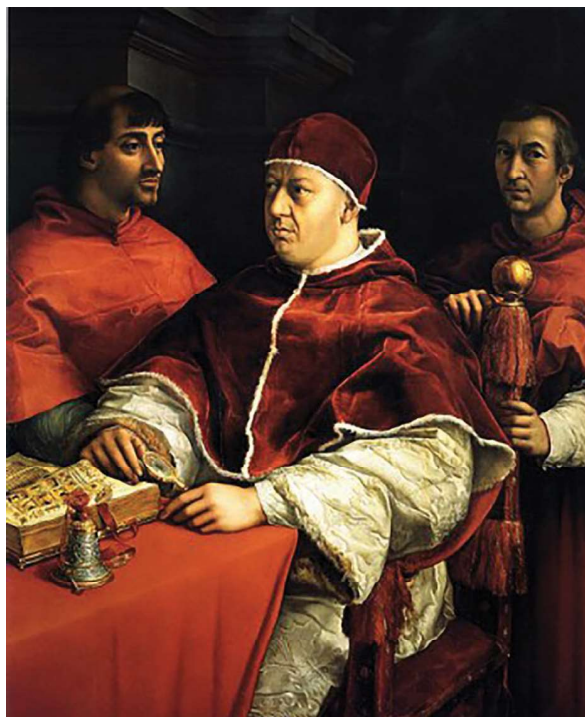
Marně čekal papež Lev X. ve Wormsu od Luthera odvolání.

Dalších 24 let se snaží Karel V. o svolání dalšího reformního koncilu. Marně a výsle-