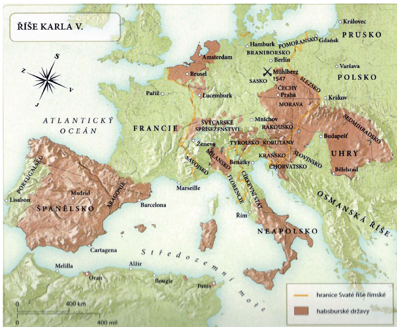
Mapa Evropy, hnědě vyznačené země pod přímou vládou Karla V.