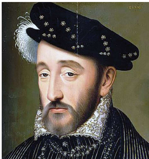
Jindřich II., stejně jako všichni francouzští králové, s radostí podpoří jakoukoliv vzpouru proti Habsburkům.

V době, kdy se zdravotní stav císaře zhorší natolik, že je v péči lékařů, vypuká v Rakousku povstání. Vzbouřenci si kryjí záda