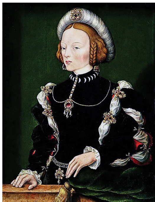
Málo císařských manželství bylo tak šťastných jako svazek Karla V. a Isabely Portugalské.