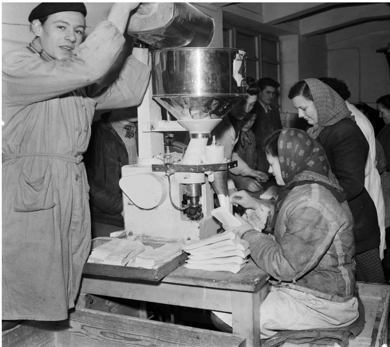
Balení vánočních balíčků pro všechny pracující v hlavních skladech „Bratrství“ v Praze IX

Vedoucí funkcionáři komunistické strany si uvědomovali, že Vánoce představují pro obyvatele Československa důležitý svátek, kdy se hodně vzpomíná a srovnává. A právě proto se podle mnohých snaží prostřednictvím tisku vylíčit situaci v prvním roce své vlády v těch nejrůžovějších barvách. Na podporu toho připravili speciální balíčky s nedostatkovým zbožím, které měly před Vánocemi zaplavit české a slovenské obchody.