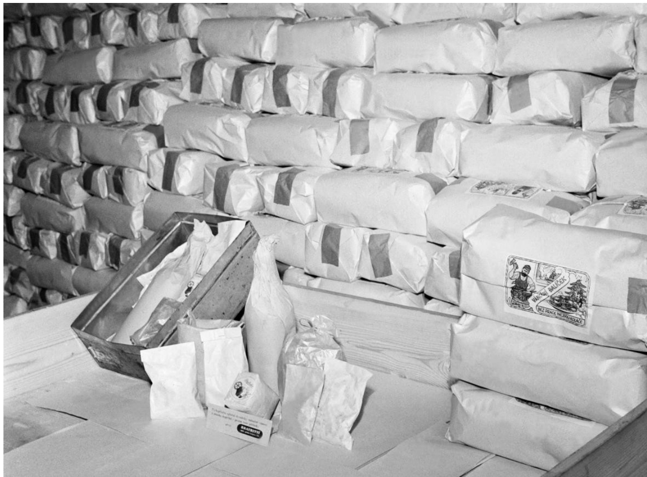
Vánoční potravinové balíčky

Lidé měli mít možnost zakoupit si bez potravinových lístků některé žádané potraviny a vylepšit si tak první Vánoce trávené pod patronací komunistické strany. Vánoční balíčky měly ovšem i důležitý politický rozměr – měly totiž dokázat, že zprávy o špatné hospodářské situaci, rozšiřované mezi obyvatelstvem šeptanou propagandou, se nezakládají na pravdě.